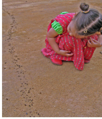
Resim 1.1: Okul öncesi dönem, çocuğun gelişiminin çok hızlı ve kritik olduğu yıllardır.

Okul öncesi dönem, çocuğun gelişiminin çok hızlı ve kritik olduğu yıllardır. Kalıtımın yanında, çocuğun doğum öncesinden başlayarak etkileşim halinde olduğu çevreden kazandıkları, onun yetişkinlikteki kişiliğini, alışkanlıklarını, değer yargılarını biçimlendirmektedir. Gelişim, döllenme ile başlayan ve ölüm ile sona eren yaşam boyu devam eden bir süreçtir. Ortalama bir insan beyin kapasitesinin ancak %1-2'sini kullanabilmektedir. İnsanın zihin kapasitesi onun beyindeki nöronlar (sinir hücresi) arasında kurduğu bağlantılara bağlıdır. İki yasındaki çocuğun beynindeki her bir sinir hücresi 15 bin bağlantı kapasitesine erişir. Beş yaşına kadar nöronlar arasındaki bağlantıların % 50'den fazlası kurulmuş olur. Bu durum 10–12 yaşına kadar devam eder. 12 yaşından sonra zayıf bağlantılar silinir, güçlü bağlantılar korunur. Bu işlem 18 yaşına kadar devam eder. 18 yaşından sonra beyin elastikiyeti azalır, ancak gücü artar.