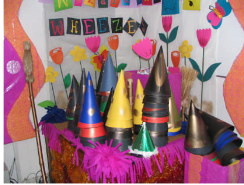
Resim 1.17: Kullanılacak araç gereç ve malzemeler, kurumun imkânlarına, çocukların yaş ve gelişim özelliklerine göre farklılık gösterebilir.

Çocukların evlerinden temin edecekleri artık malzemeler ile hoşlarına giden eğlendirici ve yaratıcı ürünler oluşturulabilir. Ayrıca bu artık materyaller, yiyecek maddelerinin etkinliklerde kullanılmasına alternatif oluşturacak ve yiyecek maddelerinin gereksiz sarfiyatını önleyecektir. Un, şeker, çeşitli bakliyatlar yerine kuruyemiş kabukları, kumaş artıkları, tuvalet kâğıdı ruloları ve birçok artık ürün, çalışmalarımızda kullanabileceğimiz malzemeler olabilir.