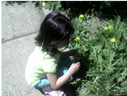
Resim 1.12: Fen ve doğa etkinlikleri çocukları gözlem yapmaya, araştırma, inceleme ve keşfetmeye yönelten etkinliklerdir