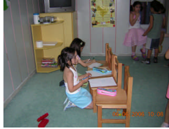
Resim 1.10: Serbest zaman etkinlikleri, ilgi köşelerinde oyun ve sanat etkinliklerinden oluşmaktadır.

Öğretmen isterse çocukların ilgisini çekmek ya da o günkü etkinliklere çocuğu hazırlamak amacıyla serbest zaman yerine farklı bir etkinlikle de güne başlayabilir. Öğretmen serbest zaman etkinliklerinde çocukların bireysel gereksinimlerine ve ilgilerine yönelik olarak çok sayıda seçeneği aynı anda sunmalıdır. Serbest zaman etkinlikleri ilgi köşelerinde oyun ve sanat etkinliklerinden oluşmaktadır. Okul öncesi eğitim kurumlarında ilgi köşeleri evcilik, fen ve matematik, sanat, resimli kitap, blok, müzik, kukla, eğitici oyuncak köşeleri ile amaçlar ve kazanımlar doğrultusunda düzenlenen geçici ilgi köşelerini içermektedir. Serbest zaman içinde sanat etkinlikleri de yapılabilir. Bu etkinlikler yağırma maddeleri, kâğıt çalışmaları, boya çalışmaları ve kolaj gibi çalışmalardan oluşur.