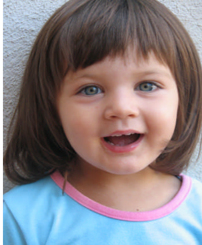
Resim 1.8: Çocuğun dile ilişkin yeteneklerinin gelişimi akıl almaz bir hızla gerçekleşmektedir.

Dil çocuğu egosundan uzaklaştırıp onun sosyal bir kişi olmasını sağlayan kendisini kontrol ve takip ettirebilen düşüncelerini ve davranışlarını yavaş yavaş öğretebilen ve