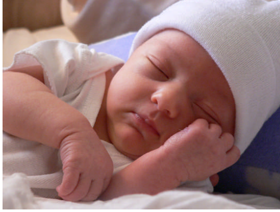
Resim 1.7: Bilişsel gelişim; çevre ile etkileşimi sağlayan, dünyayı anlamaya yarayan, bilginin edinilip kullanılmasına yardım eden ve tüm süreçleri içine alan bir gelişim alanıdır