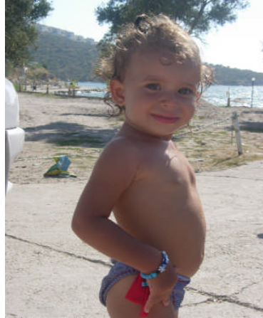
Resim 1.4: Yetişkinler gibi çocuğun da hareket etmeye ihtiyacı vardır