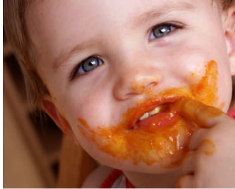
Resim 1.9: Çocuğa temel becerileri kazanmasına yönelik sık deneme fırsatları verilmelidir.

Çocukların gereksinimlerini kendi kendilerine karşılayabilir hale gelmeleri önemlidir. Çünkü çocuğun yaşamında erken başlayan öz bakım becerilerinin gelişimi ebeveynlerden bağımsızlığının başlangıcını gösterir. Bu nedenle, çocuğun yaşına uygun beceriler seçilerek küçük yaşlardan itibaren öğretilmeye çalışılmalıdır. Öz bakımla ilgili becerilerin öğretilmesinde esas amaç; çocuğun bazı temel becerileri kazanabilmesidir. Bu becerileri kazanmış çocuk, çevreden bağımsız olarak hareket edebilecek ve öz güvenini kazanmış olacaktır. Çocuğun kendi davranışlarını kontrol edebilmeyi öğrenmesi oldukça önemlidir. Çocuk isteklerini yerine getirebilmek için her zaman başkalarına bağımlı olamayacağını ve kendisinin de sorumluluk alarak yapması gereken işler olduğunu öğrenmelidir.