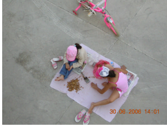
Resim 13: Çocuğun bir şeyi öğrenebilmesi için yeterli olgunluk düzeyine ulaşması gereklidir.

Hareket anlamına gelen motor gelişimde belirgin aşamalar vardır. Yetişkinler gibi çocuğun da hareket etmeye ihtiyacı vardır. Çocuk doğduğu günden itibaren bu ihtiyacını gidermek için, yattığı yerden başını kaldırma, ellerini, kollarını, başını hareket ettirme, dönme, emekleme gibi davranışları kazanır. Örneğin, bebek tek başına oturmadan önce başını kaldırmayı, emeklemeden ve yürümeden önce de oturmayı öğrenir. Araştırmalar, motor gelişimin en az üç genel kurala göre gerçekleştiğini ortaya koymuştur. Tüm çocukların motor gelişimde üç genel kuraldan söz edilebilir.