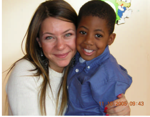
Resim 1.5: Duygusal gelişim çocuğun duygularını yaşam içinde prova etmesiyle gerçekleşir.