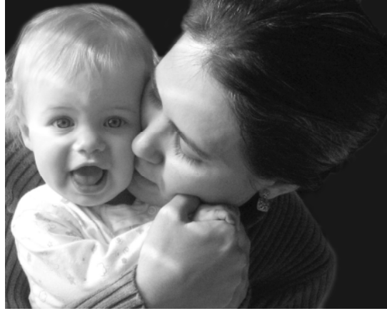
Resim 1.6: Çocuğun sevme, sevilme, güvenme, bağımsız olma gibi psikososyal ihtiyaçları da vardır