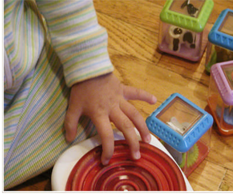
Resim 1.19: Özel eğitimde eğitim programları, bireylerin eğitsel performansları dikkate alınarak ve programın amaçları bireye uyarlanarak uygulanır

Özel eğitim gerektiren birey, çeşitli nedenlerle, bireysel özellikleri ve eğitim yeterlikleri açısından akranlarından beklenen düzeyden anlamlı farklılık gösteren bireydir. Özel eğitim; özel eğitim gerektiren bireylerin eğitim ihtiyaçlarını karşılamak için özel olarak yetiştirilmiş personel, geliştirilmiş eğitim programları ve yöntemleri ile onların özür ve özelliklerine uygun ortamlarda sürdürülen eğitimidir. Kaynaştırma eğitimi ( Entegrasyon ), özel eğitim gerektiren bireylerin diğer bireylerle karşılıklı etkileşim içinde bulunmalarını sağlayarak eğitim amaçlarını en üst düzeyde gerçekleştirmektir.