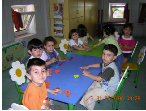
Resim 1.2: Yapılan bilimsel araştırma sonuçları; planlı bir eğitimin okul öncesi dönemde başlaması gerektiğini ortaya koymaktadır.

Okul öncesi dönem, çocuğun gelişiminin çok hızlı ve kritik olduğu yıllardır. Kalıtımın yanında, çocuğun doğum öncesinden başlayarak etkileşim halinde olduğu çevreden kazandıkları, onun yetişkinlikteki kişiliğini, alışkanlıklarını, değer yargılarını biçimlendirmektedir. Gelişim, döllenme ile başlayan ve ölüm ile sona eren yaşam boyu devam eden bir süreçtir. Ortalama bir insan beyin kapasitesinin ancak %1-2'sini kullanabilmektedir. İnsanın zihin kapasitesi onun beyindeki nöronlar (sinir hücresi) arasında kurduğu bağlantılara bağlıdır. İki yasındaki çocuğun beynindeki her bir sinir hücresi 15 bin bağlantı kapasitesine erişir. Beş yaşına kadar nöronlar arasındaki bağlantıların % 50'den fazlası kurulmuş olur. Bu durum 10–12 yaşına kadar devam eder. 12 yaşından sonra zayıf bağlantılar silinir, güçlü bağlantılar korunur. Bu işlem 18 yaşına kadar devam eder. 18 yaşından sonra beyin elastikiyeti azalır, ancak gücü artar.