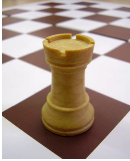
Resim 1.18: Programlar, çocukların deneme ve yanılma yolu ile öğrenmesine fırsat vermelidir.