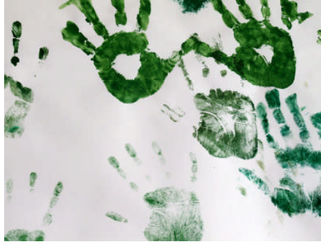
Resim 1.16: Çocuk açısından sanat çalışmaları bir nesnenin aynen kopya edilmesi anlamını taşımamalıdır.

Çocukların iyi planlanmış sanat çalışmalarıyla ve değişik malzemeler ile karşılaşması, psiko-motor, bilişsel, duygusal ve sosyal gelişimlerini destekler. Çocuk açısından sanat çalışmaları bir nesnenin aynen kopya edilmesi anlamını taşımamalıdır. Sanat etkinlikleri sırasında çocukların çalışmalarına müdahale edilmesi, onların yaratıcılıklarını ve hayal güçlerini, bağımsızlık duygularının gelişimini engeller. Eğitimci, çocukları yaratıcı çalışmalara teşvik etmek için gerekli çevresel düzenlemeleri yapmalı ve bu doğrultuda programlar hazırlayarak çocukların sanat çalışmalarına istekli katılmalarına olanak sağlamalıdır.