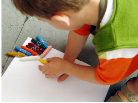
Resim 1.13: Okuma ve yazmaya hazırlık çalışmaları tüm yıl içinde, çeşitli etkinliklerde gerçekleştirilmelidir.