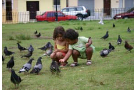
Resim 1.14: Çocukların olayı yerinde gözlemlene yolu ile öğrenme gereksinimlerini karşılamak amacıyla çevre gezileri yapılmalıdır.

Çocukların ilgisini çekecek, yöresel, kültürel, meslekî ve güncel önem taşıyan her mekân çocuk için doğal öğrenme alanıdır. Bu alanlar; içinde bulunulan yörenin tarihî bir binası, müzesi, bir ressamın sanat atölyesi, matbaa, fabrika vb. olabilir. Alan gezileri yalnızca fen çalışmaları kapsamında düşünülmemelidir. Çocukların araştırma yapma, problem çözme ve olayı yerinde gözlemlene yolu ile doğrudan öğrenme gereksinimlerini karşılamak amacıyla da çeşitli çevre gezileri yapılmalıdır.