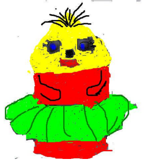
Şekil 1: İçi doldurulup, ağzı kapatılan şişe. Şekil 2: Marakasın, süslenmiş, hali