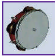
Resim 5:Tef (Sert, Sergül)

Müzik etkinliklerinde ritm çalışmalarında ve şarkı söyleme çalışmalarında en çok kullanılan ritm araçlarından biridir. Bu araç, yapımı çok kolay olduğu için öğretmen tarafından hatta öğrencilerle birlikte yapılabilir.