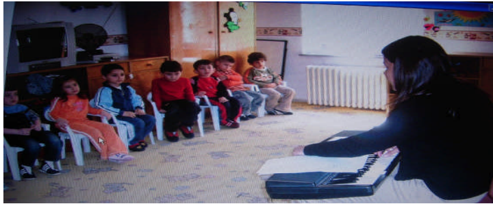
Resim 2: Ses dinleme çalışmaları

Bir başka ses dinleme çalışması da seslerin geldiği yönün tahmin edilmesi çalışmasıdır. Sesin arkadan mı, önden mi, sağdan mı, soldan mı geldiğini tahmin ederler. Sesin şiddetini yani alçak mı yüksek mi olduğunu kavrama çalışmaları da ses dinleme çalışmalarındandır.