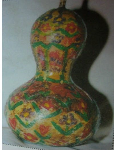
Resim 4:Su kabağından yapılmış marakas

(1) Marakasın içine konulacak şeyler mercimek, nohut vs. gibi yiyecek maddeleri olmamalıdır. Çünkü çocuklarımıza tasarruflu olmayı da öğretmeliyiz. Gıda maddelerini artık materyal olarak niteleyip, bu ve benzeri artık materyal gerektiren çalışmalarda kullanmamalıyız.