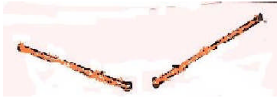
Şekil 5: Ritm sopaları

Gerekli Araç-Gereç: 30cmuzunluğunda yuvarlak sopalar,zımpara kâğıdı,küçük çanlar,guaj veya yağlı boya.