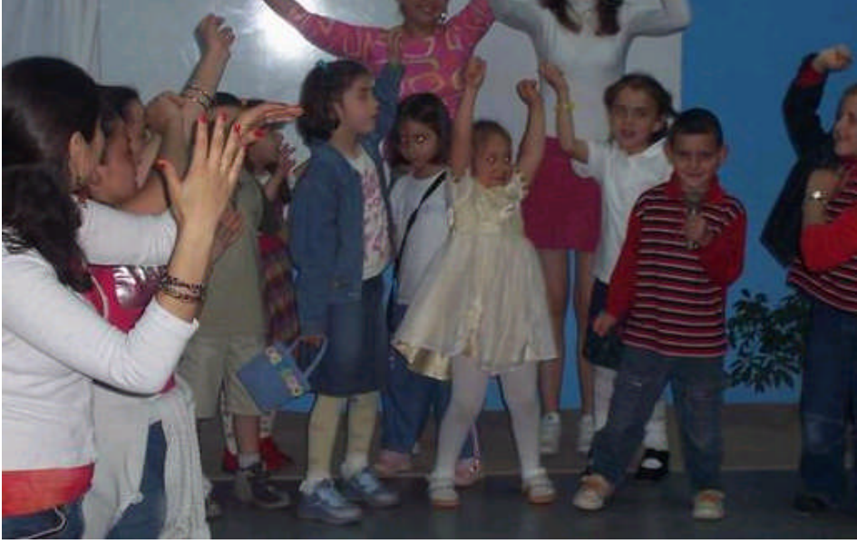
Resim 3: Müzik saatinde yaratıcı dans çalışması

Çocuklar hoplayıp, zıplayıp, yuvarlanıp duygularını hareketlerle ifade ederken, enerjinin dışı vurularak kullanımı da gerilimin azalmasına, rahatlamalarına katkı sağlar. Çocukta yaratıcılığın gelişimine katkıda bulunan bu çalışmalar, duygu ve düşüncelerini hareketlerle ifade etme becerisinin gelişmesine de yardımcı olur. Toplu olarak yapılan bir çalışma olduğu için sosyal gelişimine de katkıda bulunur. Yapılan hareketler vücut koordinasyonunu eşgüdüm), denge, esneklik gerektirdiği için psikomotor gelişime de katkıda bulunur.