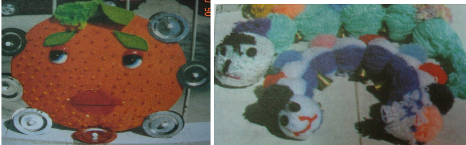
Resim 6:Artık materyaller kullanılarak yapılan zil örnekleri(Sert,Sergül)