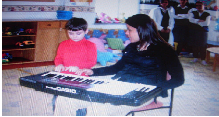
Resim 7:Müzik Etkinlikleri