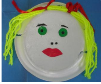
Resim 2.2: Maske hazırlamayı çocuklarda yapabilir.

Maskeler çocukların hayal güçlerini ortaya çıkarır. Çocuklar maskelerin arkasında duygu ve düşüncelerini ortaya koyarlar, kendilerini rahatça ifade ederler. Maskeler, hayali oyunlar ve drama çalışmalarında kullanılan ilgi çekici malzemelerdir. Çocukların kullanımına sunulacak maskelerin ürkütücü, korkutucu olmaması gerekir. Maskeler, kostümler, şapkalar kumaştan örgüden, kâğıttan ve çeşitli malzemelerden hazırlanabilir. Hazırlama işleminde kalıp çıkarılır, buna göre uygulanacak karakter çalışılır.