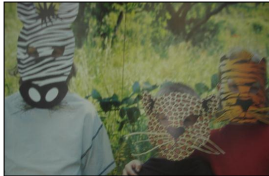
Resim 2.1: Türkçe dil etkinliklerinde maske kullandırmalıyız.