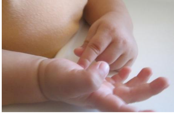
Resim 1.4: Parmak oyunları kavramları öğretir.