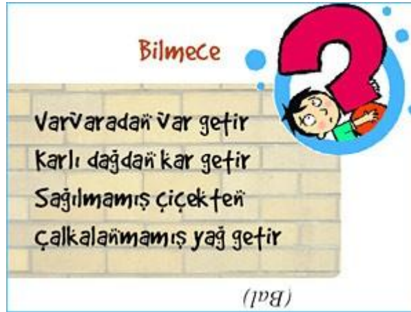
Resim 1.3: Bilmece kartı

Küçük kuşlar camları taşlar. ( Dolu ) Kıştan kaçmaz, yaprağını uçurmaz. ( Çam Ağacı ) Ezdim, büzdüm, ocak başına dizdim. ( Kış ) Kapıyı açar, kapamadan kaçar ( Rüzgâr ) Yazın giyinir, kışın soyunur. ( Ağaç ) Bir direkli, bin kiremitli. ( Ağaç ) Uzun uzun uzanır, yılda bir kez bezenir. ( Ağaç ) Ayağımı basınca kırt kırt eder Güneşi görünce eriyip gider ( Kar ) Ortaya bir gümüş top koydum, ay geldi alamadı güneş geldi aldı. ( Buz ) Kapı ve camları çarparsın. Çatı damları sararsın. Ses çıkararak esersin. Bazen de uğuldayıp kükrersin. ( Rüzgâr ) Kocaman beyaz bir adam Eriyordu tam. ( Kardan adam ) Ellerime takarım. Parmaklarımı sayarım. ( Eldiven ) Gökyüzünde beyaz toplar, Yeryüzüne iner. Çocukları sevindirir. ( Kar ) Bulutlardan süzülür. İnci gibi dizilir. Çamur olur ezilir. Bilin bakalım bu nedir? ( Yağmur ) Kapalıyken destek yapar yürürsün. Açılınca yağmurdan korunursun. ( Semsiye )