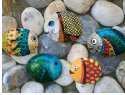
Resim 2.3: Boyanmış taşlar

Amaç 3. Sözcük dağarcığını geliştirebilme