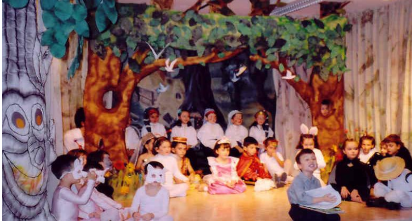
Resim 1.1: Türkçe dil etkinlikleri çocuğu hayata hazırlar.