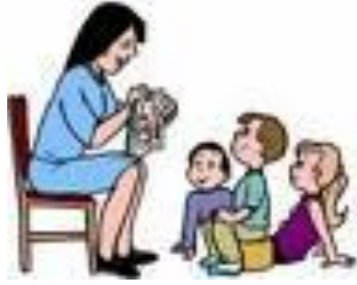
Resim 1.6: Öykü saati

Öykünün giriş, gelişme, sonuç bölümü bulunur. Gelişme bölümünde yer alan olayların hareketliliği çocukların yaş ve gelişim seviyelerine, ilgi alanlarına, dikkat sürelerine ve ihtiyaçlarına göre düzenlenir. Öykülerde eğlence unsurunun bulunması çocukların öykü dinlemekten daha fazla zevk almasını sağlayacağından çocukların kitaplara ve okumaya ilgilerini artırır. Öğretmen, öyküyü anlatmadan önce ön hazırlık yapmalıdır. Öyküyü önce kendisi birkaç kez okumalı, çocuklar için uygun olup olmadığına karar vermelidir. Çocuklar için yeterince uygun değilse olaylarda çok abartı veya olağanüstü ve olumsuz öğeler varsa çıkarılır, gerekli düzeltmeler yapılır, anlatım gerçeğe yaklaştırılır. Öykülerde farklı özelliklerde karakterlerin bulunması çocuklara yeni görüş açıları kazandırır. Öykülerin yaşamın içinden konuları ele alması, çocuğun içinde yaşadığı toplumun kültürel özelliklerini daha iyi tanınmasına yardımcı olur.