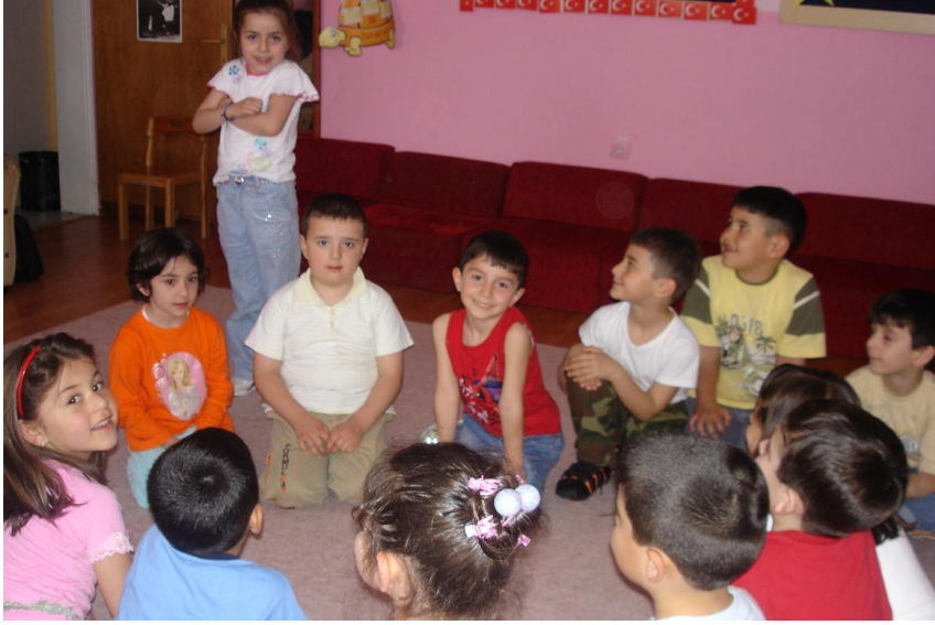
Resim 1.2: Sayışma tekerlemesi söylerken çocuklar eğlenir.

Tekerlemeler; masalların, halk öykülerinin bazen başında bazen sonunda bazen de söz aralarında söylenen sözlerdir. Tekerlemeler konuyla ilgili olabilir veya sadece mizah unsuru taşır. Bunların dışında bazıları da anaokulunda çocuklarla söylemek üzere eğitici amaçlı düzenlenmiştir.