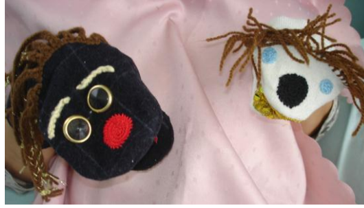
Resim 1.7: El kuklası

Kuklalarla öykü anlatırken bir kukla sahnesi hazırlamalı veya sınıfta bulunan eşyalarla kukla sahnesi düzenlenmelidir. Kukla oynatırken müzik kullanılabilir. Kuklalarla anlatılacak öykü seçimi önemlidir. Korkunç öykülerden, eğitimsel değeri olmayan konulardan kesinlikle kaçınılmalıdır. Kukla konuşurken daima yüzü izleyiciye dönük olmalıdır.