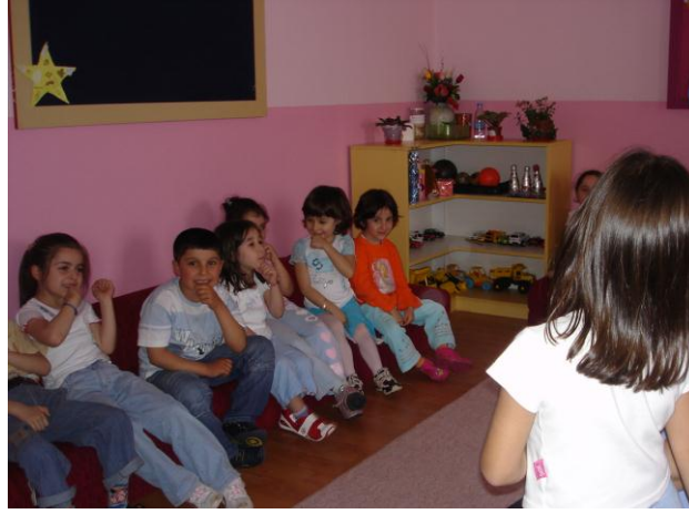
Resim 1.5: Sohbet çocuğu düşünmeye sevk eder.

Öğretmen, bu etkinliđi yürütürken çocukların konu hakkındaki görüşlerini almak için onların yaşantılarından yola çıkarak sorular sormalıdır. Bu, çocukların konuşmalara katılımını kolaylaştırır. Sorulan sorulara çocuklar cevap vermediklerinde soru yeniden farklı bir şekilde sorulmalıdır. Çocukların açıklamaları öğretmen tarafından değerlendirilmeli, eksikler tamamlanarak pekiştirilmelidir. Öğretmen vereceđi kavramı, temayı günlük eğitim programında yer alan tüm etkinliklerle verebilir. Bu nedenle grup konuşması bir derse dönüştürülmemelidir. Konuşma esnasında bütün çocukların konuşmalara katılımı sağlanmalıdır. Pasif dinleyici yerine aktif ve katılımcı hâle gelmesi desteklenmelidir.